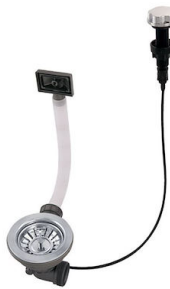
Desagüe automático 8407 100