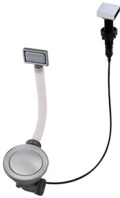
Desagüe automático Space - PA 8407 108